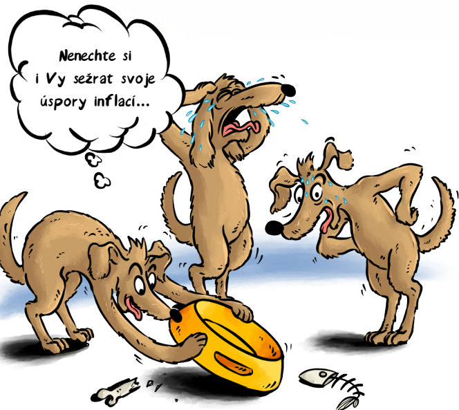
ČÁSTKA NA BĚŽNÉM ÚČTĚ, ČI DOMA 100.000,-

V prvním čtvrtletí roku 2022 se očekává meziroční inflace k 8%, možná až k 10%. Potom ekonomové předpokládají, že by inflace mohla klesat. Pro ochranu financí proti inflaci dnes existuje řada nástrojů. Ať jsou to různé typy dluhopisů, nemovitostní fondy či komodity. Rádi vám v tom poradíme.